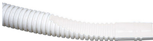
Sezione del tubo