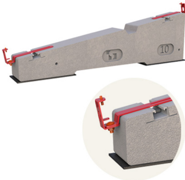
Installationsbeispiel auf 10° Ballast