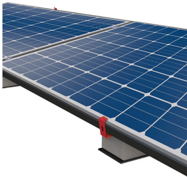
Installationsbeispiel mit angewendetem Panel