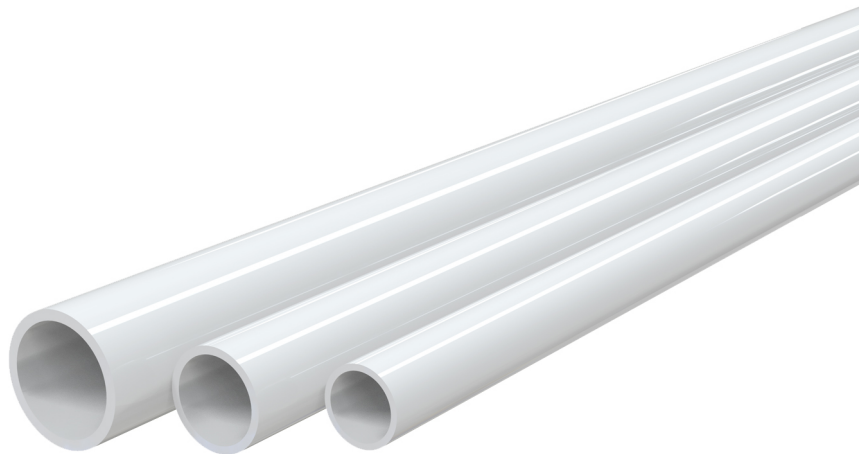
TCR-32 TCR-25 TCR-21

- cod. 11126324 - cod. SCD300034 - cod. SCD300033