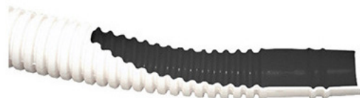
Sezione del tubo con doppio rivestimento